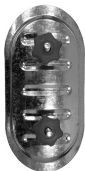
для круглых воздуховодов