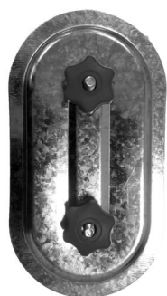
для прямоугольных воздуховодов